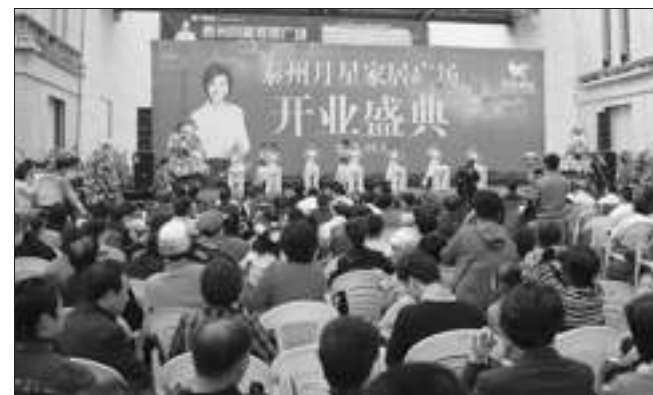
春兰旗下泰州“星威园”首期工程——星威商厦之泰州月星家居广场开业盛况。