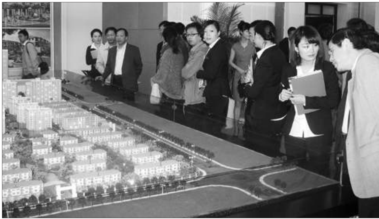
2011 泰州秋季房博会上春兰旗下泰州“星威园”楼盘受到购房者 and 广大市民热捧。

业内人士认为,泰州月星家居广场入驻星威商厦,对丰富泰州城东区域的业态组合,扩容泰州市区的商业体量,聚集更