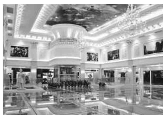
装饰一新、气势恢弘的泰州月星家居广场内景。