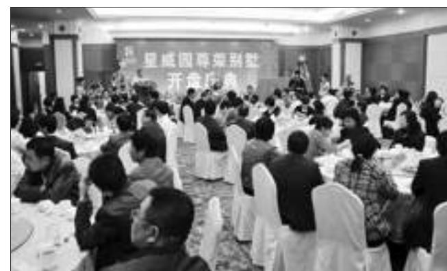
星威园·尊荣别墅开盘庆典场景。

五期工程是在星威商厦泰州月星家居广场西侧,建设综合性百货商场和大型超市,于星威商厦泰州月星家居广场连成一体,以家居、百货、超市卖场、美食产业为平台,形成城东集商贸流通、休闲购物、饮食娱乐等多功能于一体的大