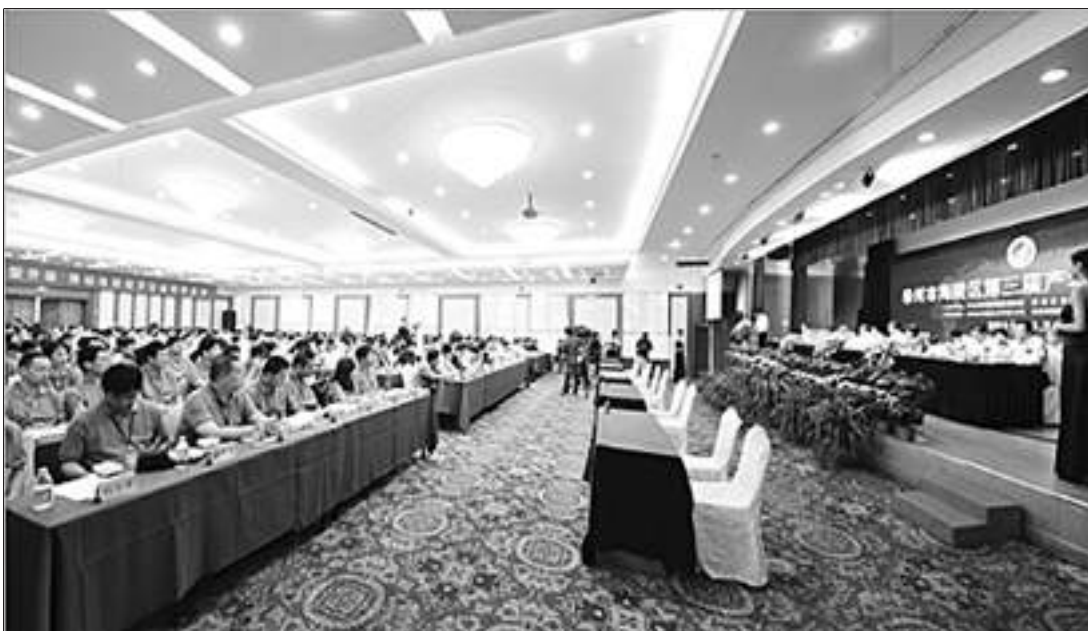
泰州市海陵区第三届产学研合作大会场景。

目前,春兰清洁能源研究院有限公司已成立“大容量动力电池关键技术研发中心”,深度研发适用于各种新能源汽车(混合动力汽车、纯电动汽车)、高速机车,以及储能电站、电力电站、风力电站、太阳能电站等领域的大容量动力电池新产品。(高宣)