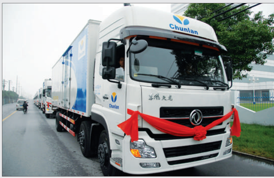
为拓展产品装载与运力空间，进一步提高物流效率，使供应链持续保持高效运行态势，日前，春兰新增了24辆6.8米厢式货车。目前，新增车辆已全部投入使用。

据悉，此次博览会上，春兰展出了“绿色直流变频”系列、“超级静博士”系列、“无氟静博士”系列家用空调新品，中央式（风管机和冷水机组）、嵌入式、单元式、多联式等商用空调新品，以及高效节能环保空调压缩机、高能动力镍氢电池和高能动力锂离子电池等。众多来自印尼、越南、老挝、柬埔寨、泰国、缅甸、菲律宾、马来西亚、新加坡等国的客商，纷纷驻足春兰展位，一边欣赏春兰产品，一边询问相关情况。不少客商，在了解了产品性能、价格等基本情况后，当即与春兰签订合作意向。(向东)