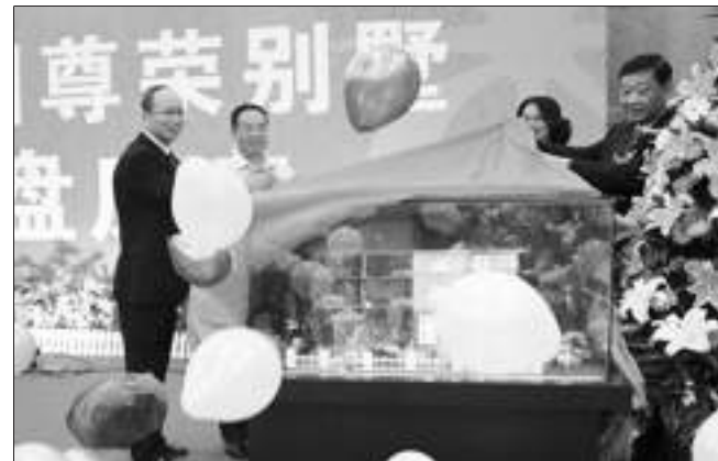
与会领导为星威园·尊荣别墅开盘揭幕。