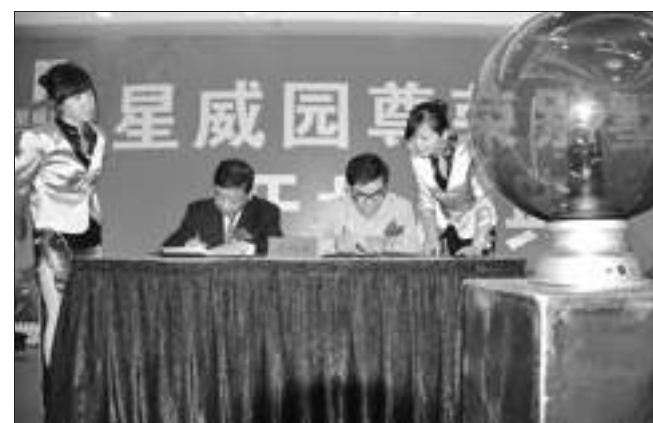
购房者(右二)在签订购房协议。