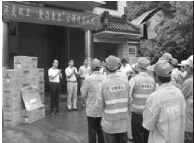
春兰向江苏省环卫劳模和先进代表赠送春兰空调。