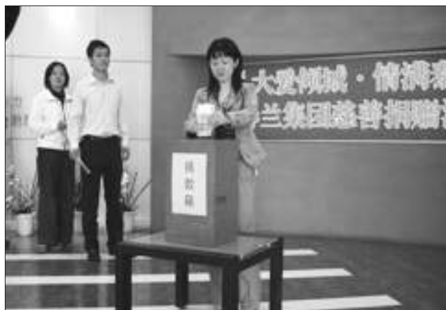
春兰员工向泰州市慈善机构捐款。