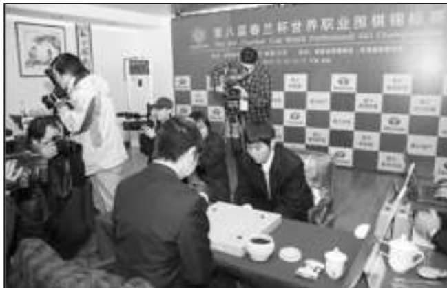
春兰出资创办的第八届“春兰杯”世界职业围棋锦标赛决赛场景。