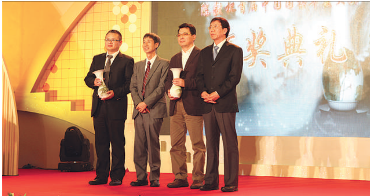
春兰（集团）公司副总裁刘亚夫（右二）与中国围棋协会主席王汝南（左二）、副主席华以刚（右一）在“陈毅杯”首届中国围棋年度大奖颁奖典礼上。