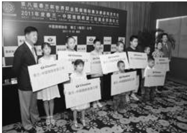
获得2011年“春兰-中国‘围棋希望工程’基金”资助的10名少年棋手。