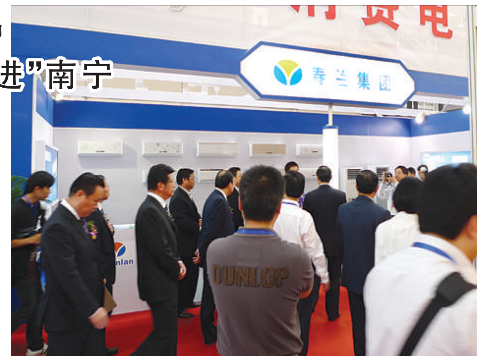
南宁展销会上，春兰展位吸引了众多嘉宾和客商。

据悉，自“江苏产品万里行”活动启动以来，春兰已先后参加了其在武汉、西安、沈阳、长沙等地举行的多场大型展销会。（欣雯）