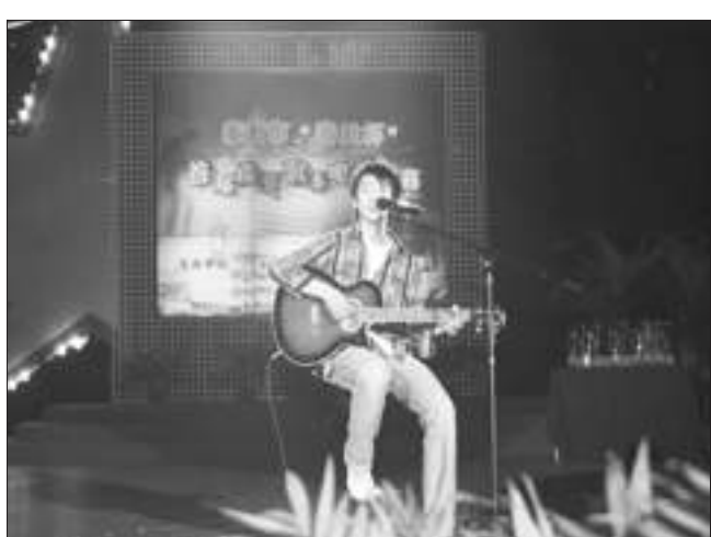
春兰赞助的泰州市“春兰杯”首届校园歌手电视大赛场景。