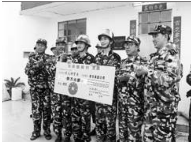
春兰向南沙驻岛官兵送上春兰员工奉献的一片心意。