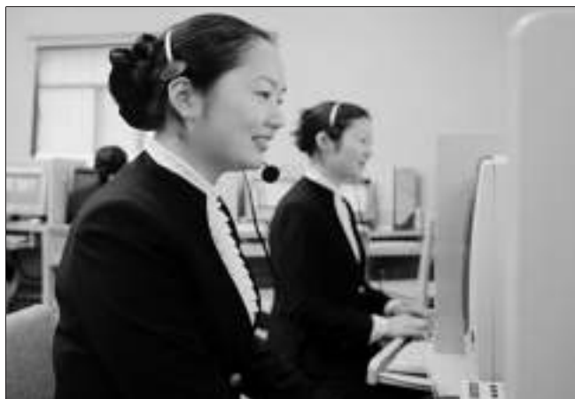
春兰“24小时服务热线”实现沟通无限,成为春兰连接广大消费者的重要纽带与桥梁。

第三环节是成品质量管理。春兰产品在出厂前平均要经过配件检测、在线检测、下线检测、成品检验等数十道检测工