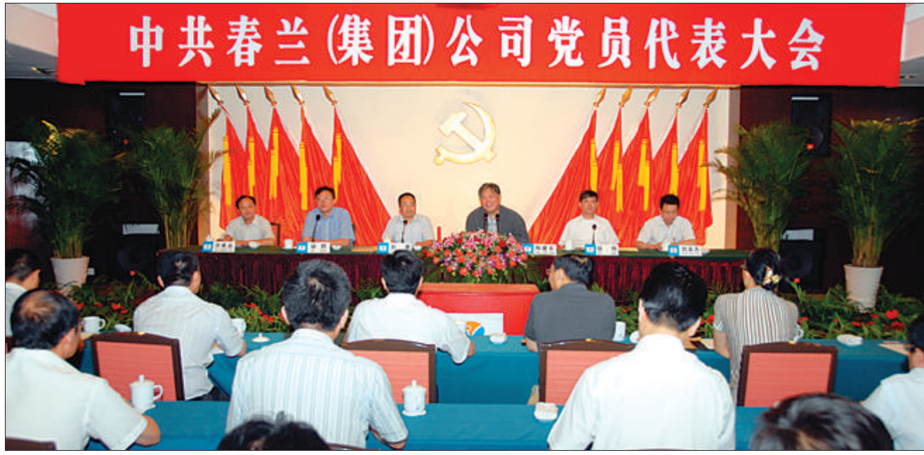
中共春兰(集团)公司党员代表大会会场。