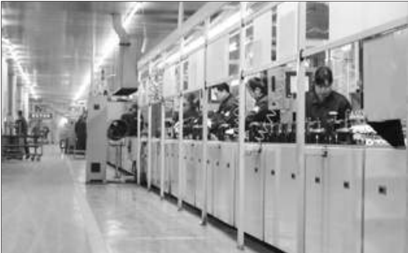
春兰变频压缩机生产线。

责人说,从世界空调业的发展来看,节能化、环保化、变频化是大势所趋,而在这些方面,春兰素以技术领先著称。目前,该公司生产的变频压缩机基本上用于满足春兰直流变频空调的生产需求,当然,将来会向其它空调生产厂商供货,从而形成更具竞争力的配套优势,这样,既确保了春兰空调在核心零部件上的供给,同时又使公司产业链有效延伸,并分享变频压缩机市场化所带来的相对丰厚的盈利。另悉,目前,春兰已开发和规划开发的变频压缩机,包括R410A无氟环保制冷剂在内的多种冷媒、多种冷量、多种型号、多种电源的新品。(万方)