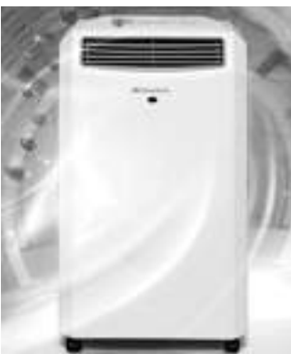
春兰近期推出的除湿机新品。