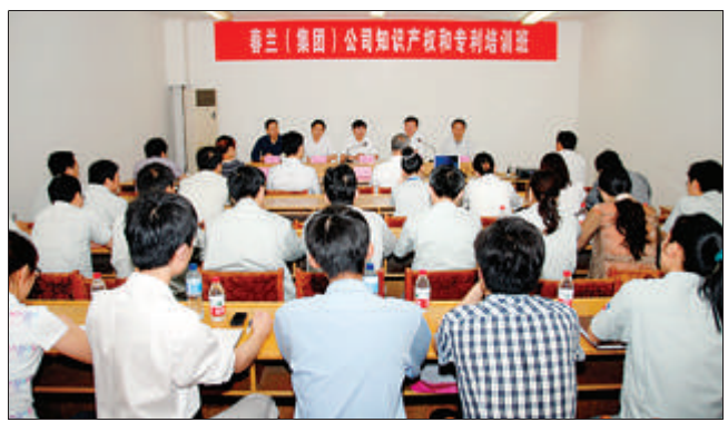
春兰知识产权和专利培训班开班仪式。

培训结束后,学员们进行了讨论交流,并就与工作密切相关的问题咨询了主讲专家,同时均撰写了学习心得。大家表示在今后的工作中,充分运用此次所学的知识,努力把本单位的知识产权和专利工作做得更好。(华澄余)